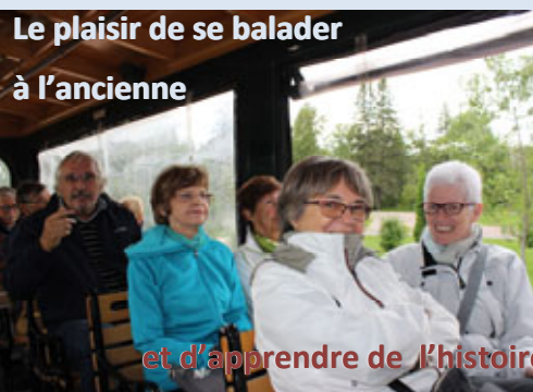
Le plaisir de se balader à l'ancienne