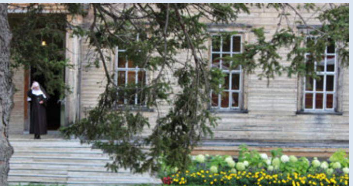
Le plaisir d'évoquer le passé.