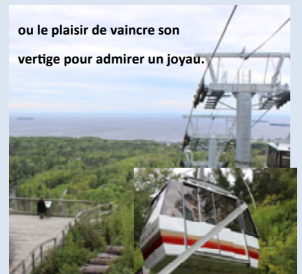
ou le plaisir de vaincre son vertige pour admirer un joyau.

http://www.jcl.qc.ca/detail_livre/rossignol-de-val-jalbert-t-2/