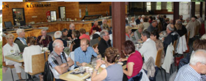
Le plaisir de partager un délicieux repas.